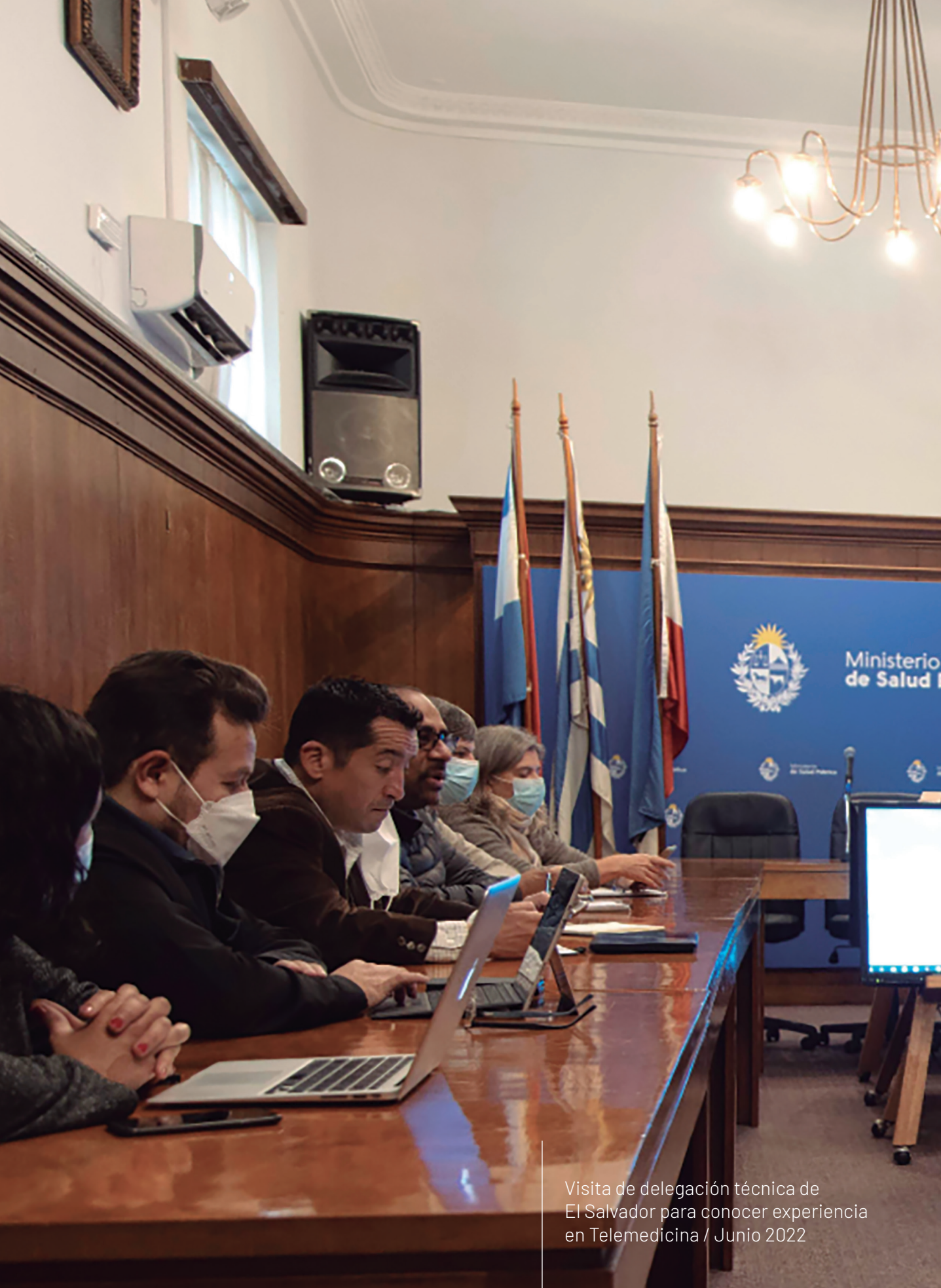
Visita de delegación técnica de El Salvador para conocer experiencia en Telemedicina / Junio 2022